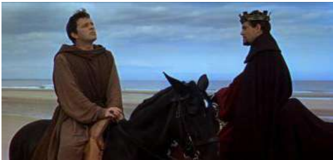
Richard Burton e Peter O'Toole em "Becket" (1964).

Uma das figuras mais admiráveis da história da Igreja é o inglês São Thomas Becket. Morreu como mártir, aos 29 de dezembro de 1170 (ano em que provavelmente nasceu São Domingos), assassinado em sua própria catedral, na Cantuária. Mas, por que Thomas Becket pode ser tido como admirável? Porque quando no poder, ao invés de se corromper, converteu-se. De fato, um milagre.